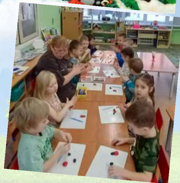
Лепка «Снегири на ветках»