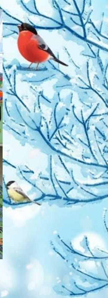
Апликация «Снегирь на ветке»