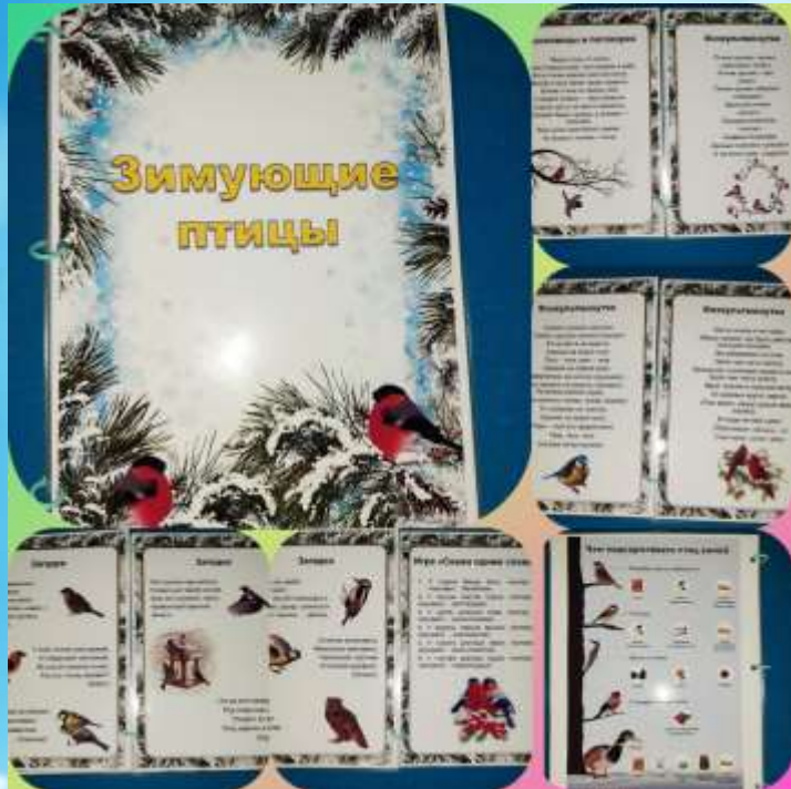
Картотека «Зимующие птицы»