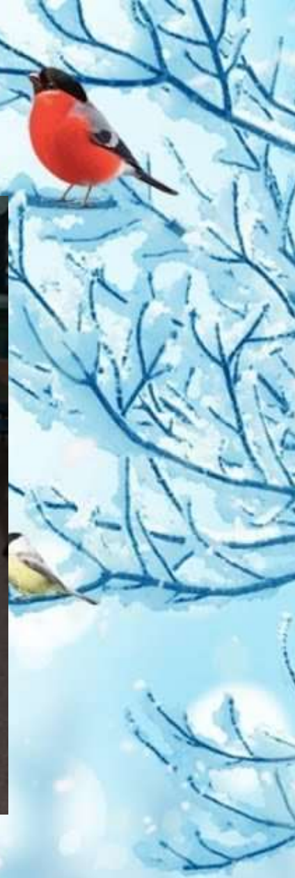
Макет «Зимующие птицы»